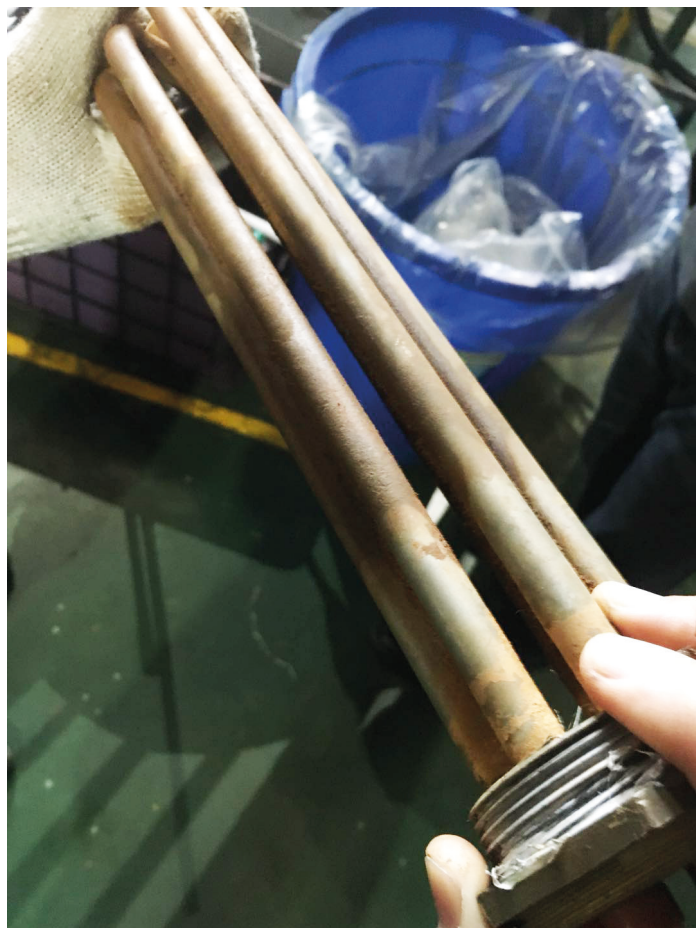
安装沃肯(Vulcan)一年半后未清洗的换热器