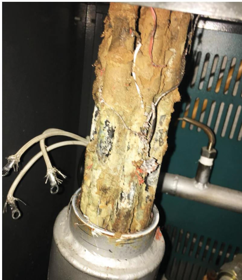
三年未作处理的换热器结垢情况